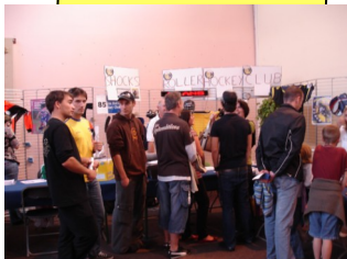
Le stand du forum des associations